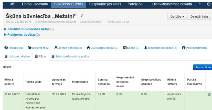
14. attēls: Pilnībā apmaksāts rēķins

→ Ievadot ienākušo summu, samazināsies neapmaksātais atlikums. Ja uzreiz visa summa tiek apmaksāta, tad paliek pa 0.0 un rēķins iekrāsojas zaļā krāsā (rēķina statuss APMAKSĀTS PILNĪBĀ ):